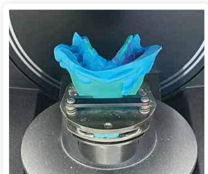
Van Guus Baakman tandtechniek