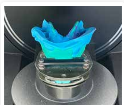
Van Guus Baakman tandtechniek